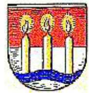
▲ Wappen von Lichterfelde in Berlin

Bereits 1995 begann ich mit der Veröffentlichung von Web-Seiten zu den vielfältigen Problemen der Thermometer-Siedlung in Lichterfelde-Süd. Viele weitere Web-Seiten dazu – auch zum Soziologischen und dem Privatisierungschaos bei den Wohnungen (GSW-Verkauf!) – sind seit dem gefolgt. Das seit 2010 bekannte Planungs-Begehren eines geldgierigen Investors, südlich der Thermometer-Siedlung etwa 100 Hektar noch weitgehendes Naturland (früherer US-Truppen-Übungsplatz) zubauen zu wollen, führte Anfang 2011 zur Bildung des großen „Aktionsbündnis Landschaftspark Lichterfelde-Süd“.